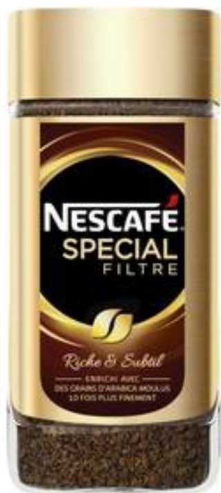
Nescafé spécial filtre 200 g