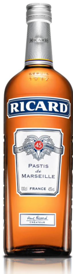
Ricard 1 l

(VIA LES SITES DRIVES / 4 825 POINTS DE VENTE, le 12 février)