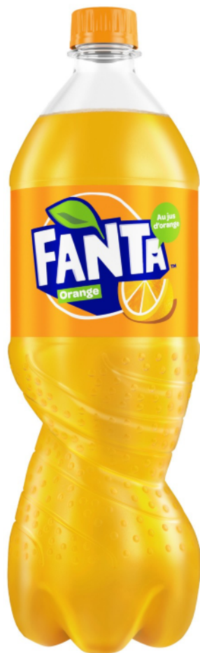
Fanta orange 1,5l

(VIA LES SITES DRIVES / 4 825 POINTS DE VENTE, le 12 février)