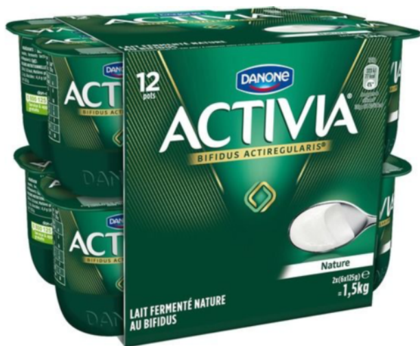
Activia nature x 12